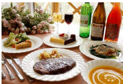
夕食はステーキがメインのフレンチ・フルコース。

厳選した食材をつかって一つ一つ丁寧にお造りします。ビールや日本酒、焼酎の他に人気の無添加・無農薬のワインも揃えております。