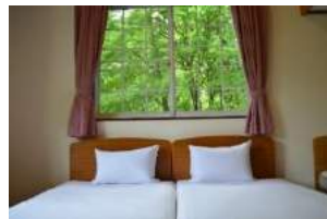
フランスベッド (3台)