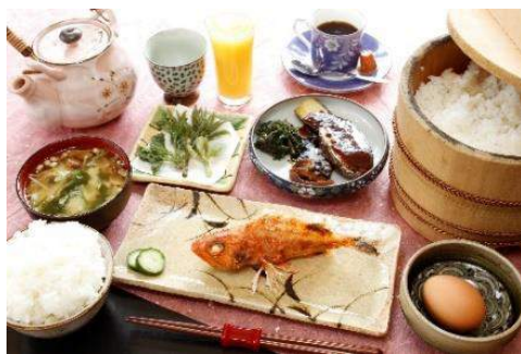
自慢の朝食は和食。