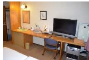
客室のアメニティ