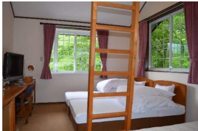
客室は南向き洋室10畳ロフト付き

3階の客室は全5室。全室禁煙。窓からの眺望は、四季折々の自然の森を見渡せます。のんびりと贅沢な一時をお過ごし下さい。